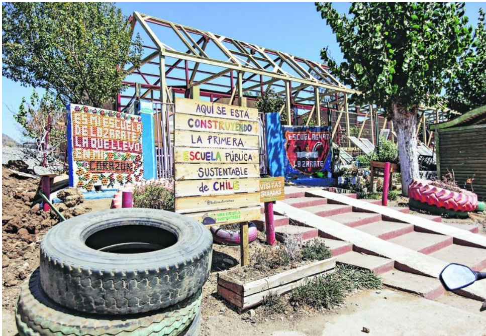
La fachada en construcción de la primera escuela sustentable en Chile

permacultura, busca dejar un sello en el sistema educativo. Ahí entra Camnitzer, junto a la fundación Arte Como Educación (ACE), que quiere implementar una metodología preparando a educadores para fomentar el pensamiento artístico y que así que más allá del edificio, exista también una cultura sustentable en la educación.