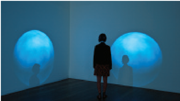
Lunar , 2002/2003, in collaboration with Ronaldo Kiel and Olhar Periférico, digital video and projection, approx. 36m2. Music: Rogério Rochlitz. One Thousand and One Days and Other Enigmas . Iberê Camargo Foundation, Porto Alegre, RS. Lunar , 2002/2003, realizado en colaboración con Ronaldo Kiel y Olhar Periférico, vídeo digital y proyección, aprox. 36m2. Música: Rogério Rochlitz. Mil y Un Dias y Otros Enigmas . Fundación Iberê Camargo, Porto Alegre, RS.